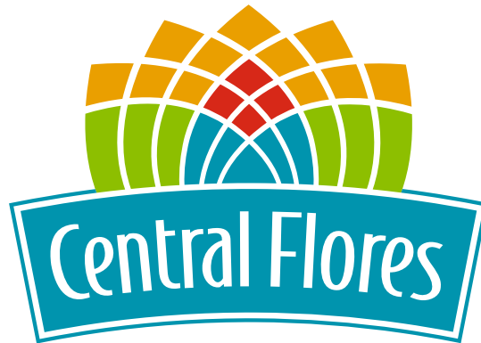
NOVO LOGOTIPO CENTRAL FLORES

INSTITUCIONAIS E CRIAÇÃO DE PEÇAS PROMOCIONAIS