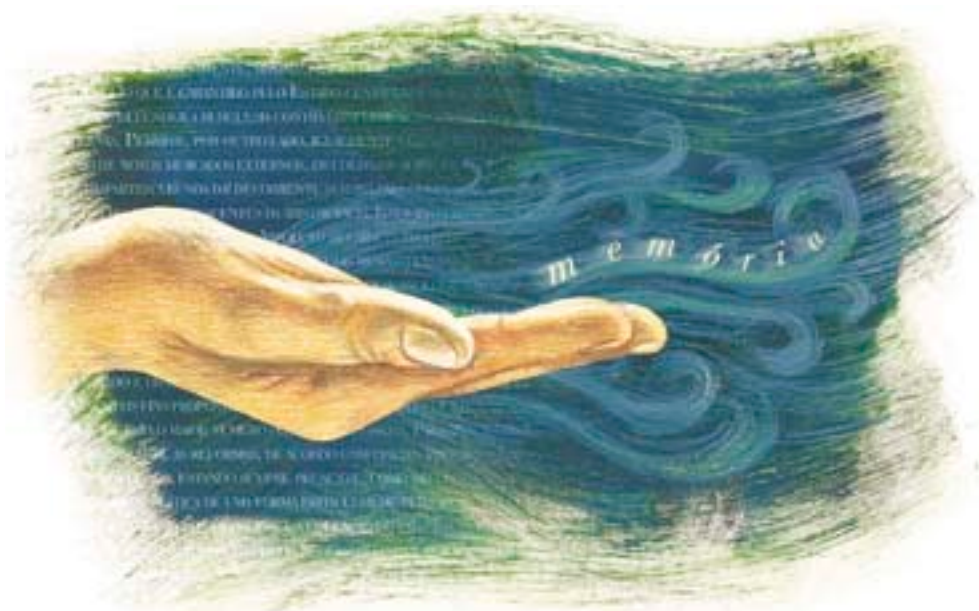
ILUSTRAÇÃO PARA A REVISTA DO CONSELHO DE JUSTIÇA FEDERAL