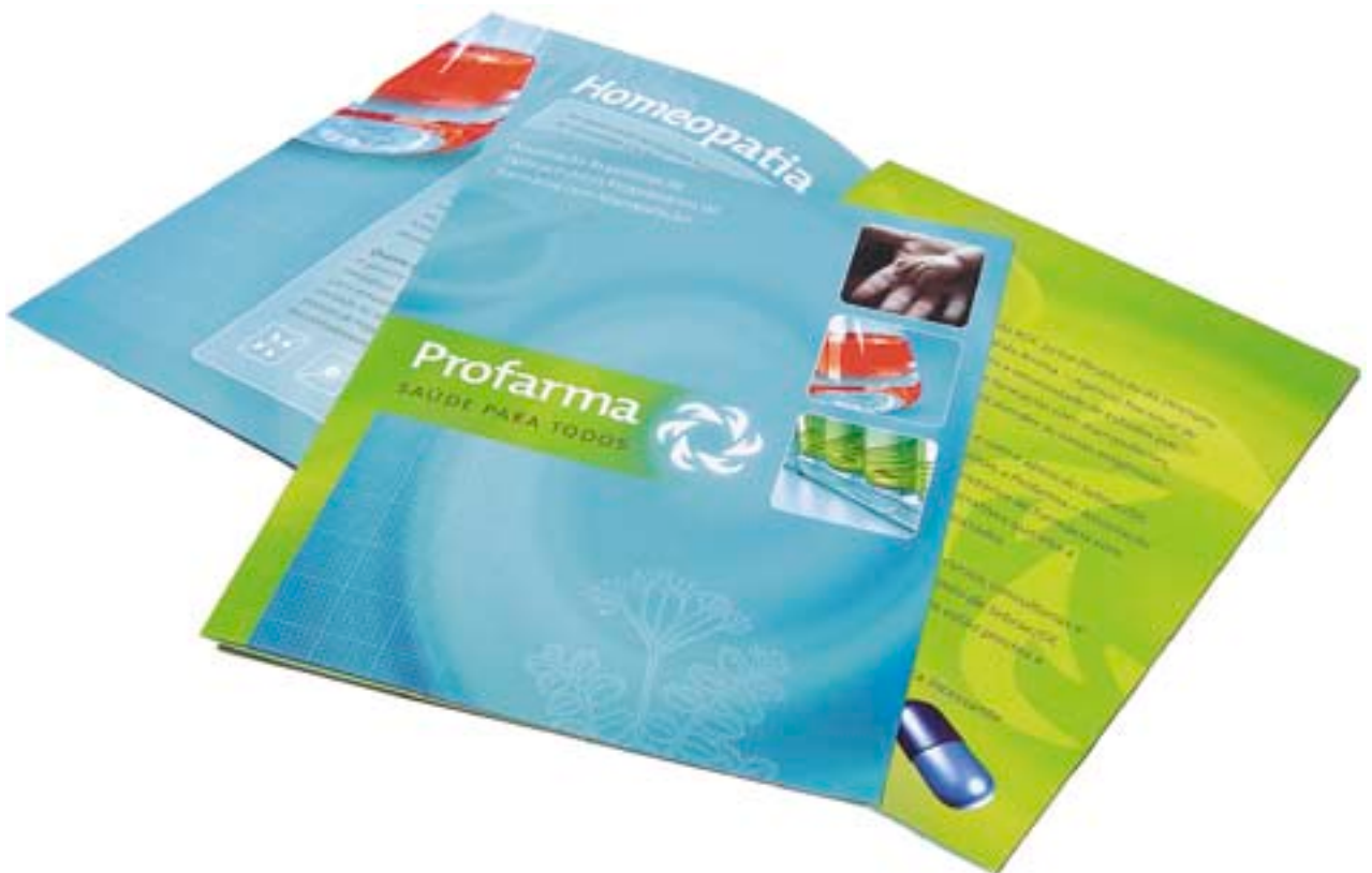
FOLDER PROMOCIONAL (CAPA)